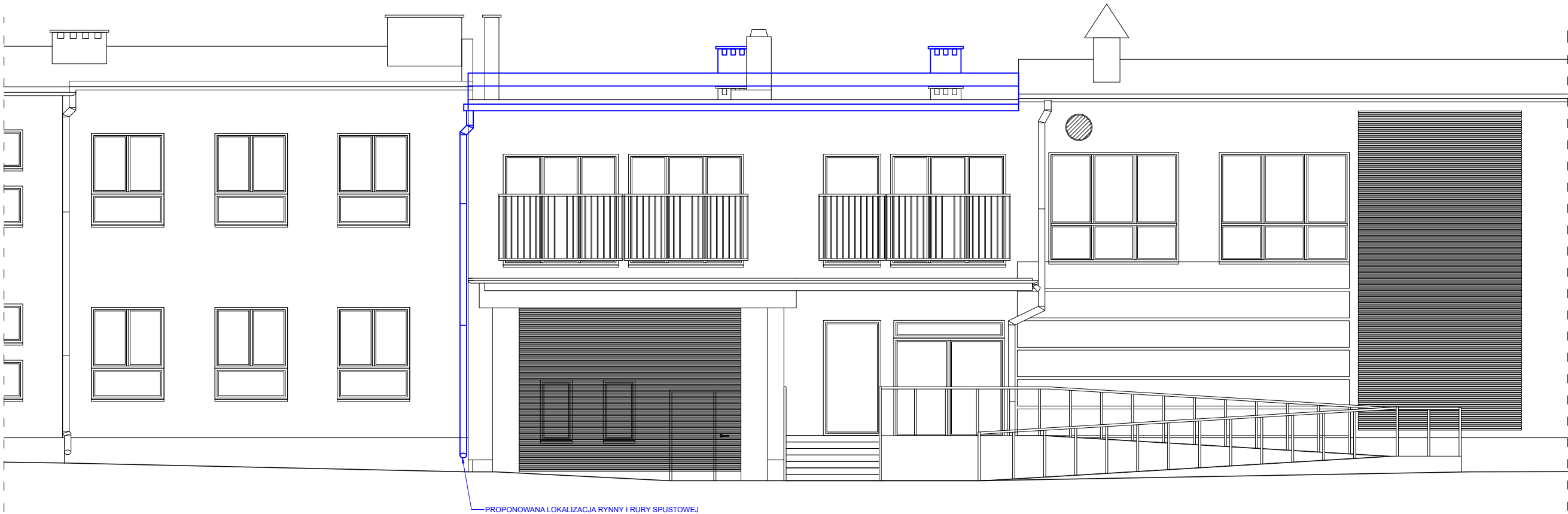
Elewacna północna-wschodnia (1:100)